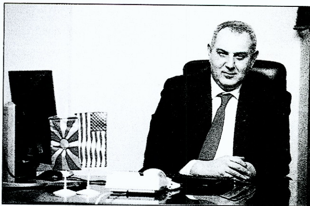
Д-р Марјан Бојаџиев, ректор на Универзитет Американ Колеџ